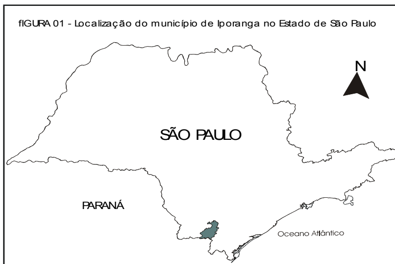
Figura-1-Localização do município de Iporanga no Estado de São Paulo.

Além disso o município apresenta um dos mais baixos índices de IDH (Índice de Desenvolvimento Humano) em torno de 0,59, sendo um das cidades mais pobres da região ficando a frente somente dos municípios de Barra do Turvo, Barra do Chapéu e Itapirapuã Paulista, sendo que Registro na vale apresenta um índice de 0,84 conforme (SÃO PAULO,1999).