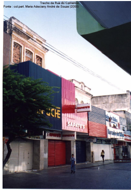
Foto 01 Rua do Comércio