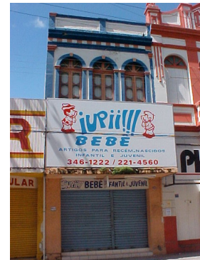
Foto 03 Fachadas

Na formação das ruas de Maceió, as primeiras são Rua do Comércio, Rua Augusta, Rua Moreira Lima e Rua do Livramento, todas do século XVIII, onde continuam com o mesmo arruamento da época.