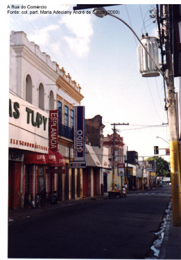
Foto 03 Rua do Comércio